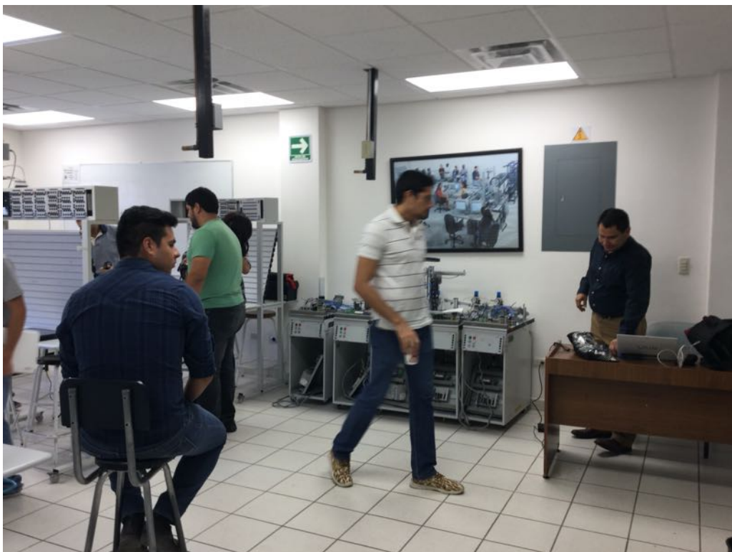
Figura 3. laboratorio de mecatrónica vista general. Edificio 8D