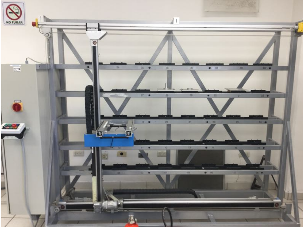
Figura 4. Tecnología de clasificación y reconocimiento de piezas para ensamble en laboratorio de mecatrónica. Edificio 8D