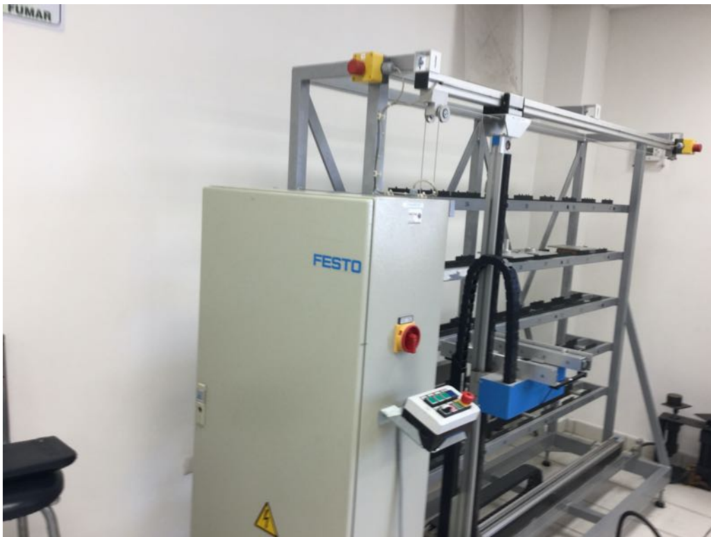
Figura 5. Tecnología festo para ensamble automático en laboratorio de mecatrónica. Edificio 8D