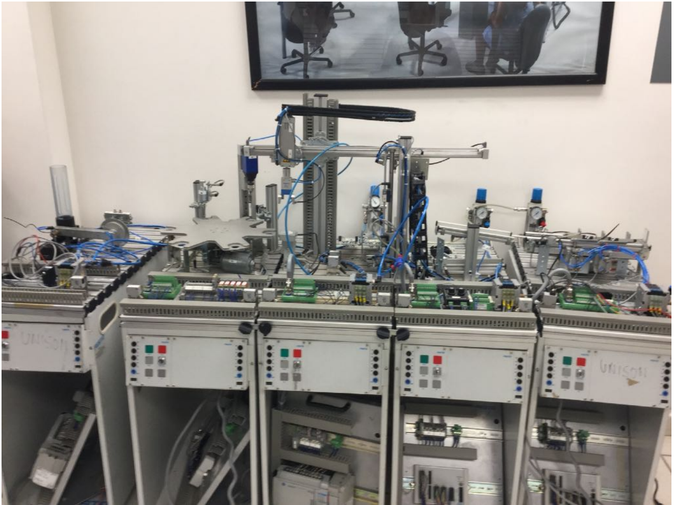
Figura 1. Sistemas de instrumentación y control industrial en laboratorio de mecatrónica. Edificio 8D